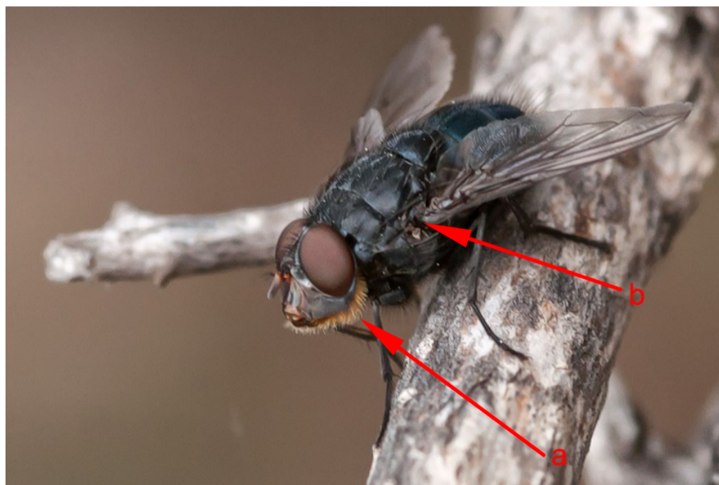
Foto 1: Calliphora vomitoria . Se aprecian claramente las cerdas de la parte posterior de las mejillas de color dorado (a) y la basicosta negra (b).

1.- (1a) Cerdas de la parte posterior de las mejillas de color dorado. Genas oscuras o negras. Basicostas negras. Machos con ojos holópticos, hembras con ojos dicópticos ..... Calliphora vomitoria (Linnaeus, 1758)