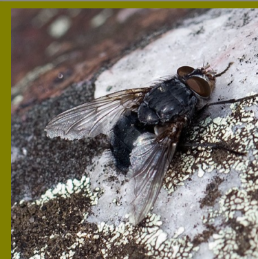
Calliphora vicina .

Es el género tipo de la familia Calliphoridae. Comprende moscas de tamaño medio a grande, de tórax grisáceo, caliptros inferiores pardos con borde pálido y abdomen azulado metálico. La vena media alar presenta una notoria concavidad, más acusada que en otros géneros de Calliphoridae. Depositán sus huevos sobre carne en descomposición. Dos especies se encuentran en la fauna de la Península Ibérica y Baleares.