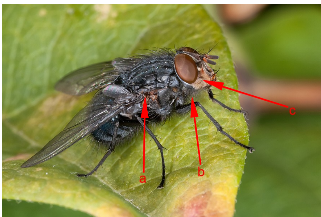
Foto 3: Calliphora vicina . Se aprecia el tono claro de la basicosta (a), el color oscuro de las cerdas tras las mejillas (b), y el tono rojizo de las genas (c).

(1b) Cerdas de la parte posterior de las mejillas de color negro. Genas rojizas. Basicostas palidas. Machos con ojos holópticos; hembras con ojos dicópticos..... Calliphora vicina Robineau-Desvoidy, 1830