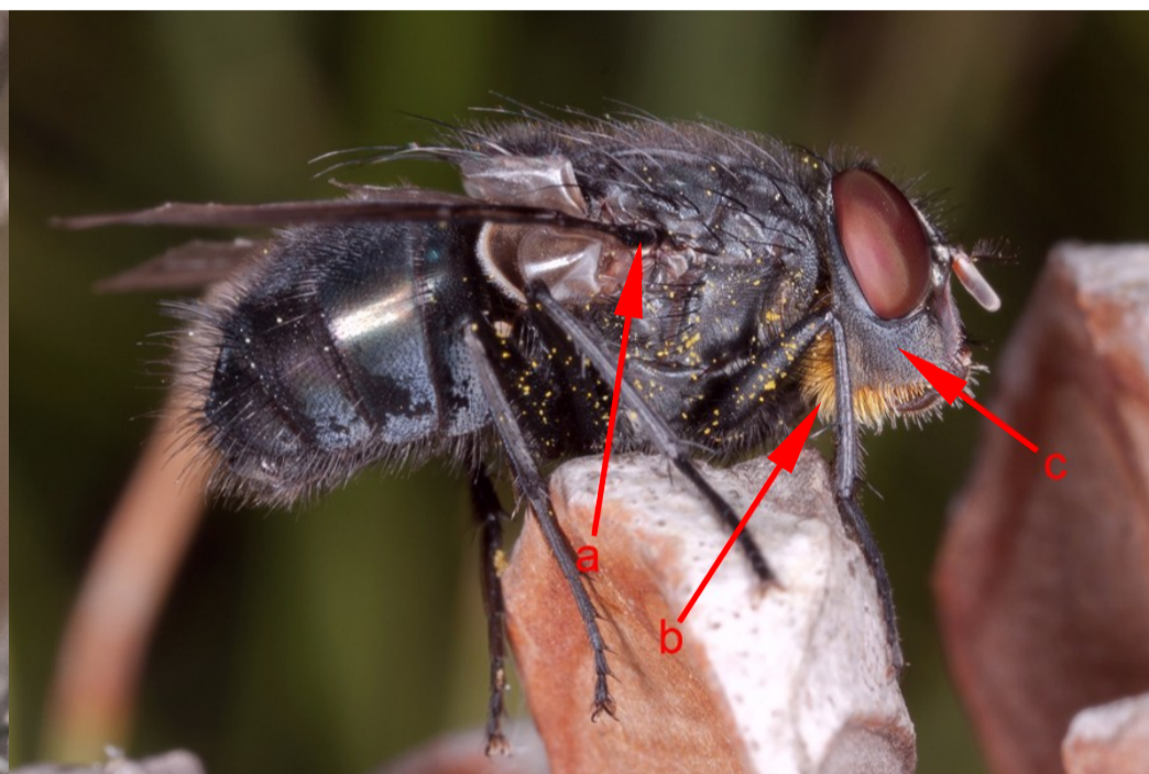
Foto 2: Calliphora vomitoria . Al igual que en la foto anterior, se aprecia el color negro de la basicosta (a), el color dorado de las cerdas tras las mejillas (b), y el tono oscuro de las genas (c).

(1b) Cerdas de la parte posterior de las mejillas de color negro. Genas rojizas. Basicostas palidas. Machos con ojos holópticos; hembras con ojos dicópticos..... Calliphora vicina Robineau-Desvoidy, 1830