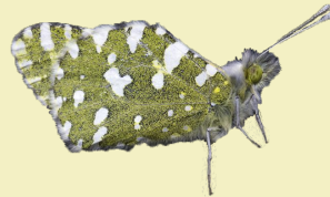
7. Euchloe crameri