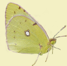
9. Colias alfacariensis