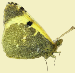
6. Euchloe bazae ssp. iberae