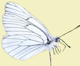
10. Aporia crataegi