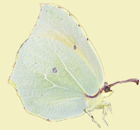
3. Gonepteryx cleopatra