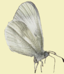
6. Leptidea sinapis