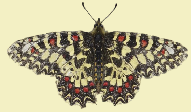
3. Zerynthia rumina