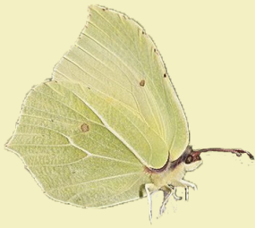
4. Gonepteryx rhamni