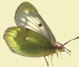
8. Colias phicomone