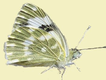
11. Pontia daplidice