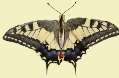
2. Papilio machaon