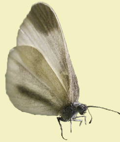
5. Leptidea reali