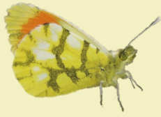
1. Anthocharis belia