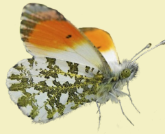
2. Anthocharis cardamines