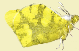
11. Zegris eupheme