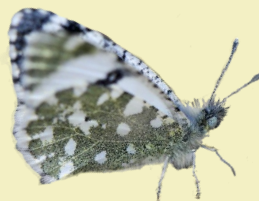
10. Euchloe tagis