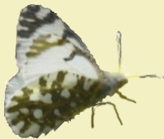
9. Euchloe simplonia