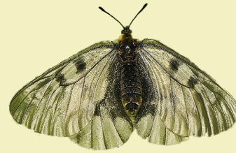
5. Parnassius mnemosyne