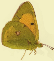
7. Colias crocea