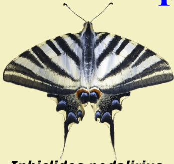
1. Iphiclides podalirius ssp. feisthamelii