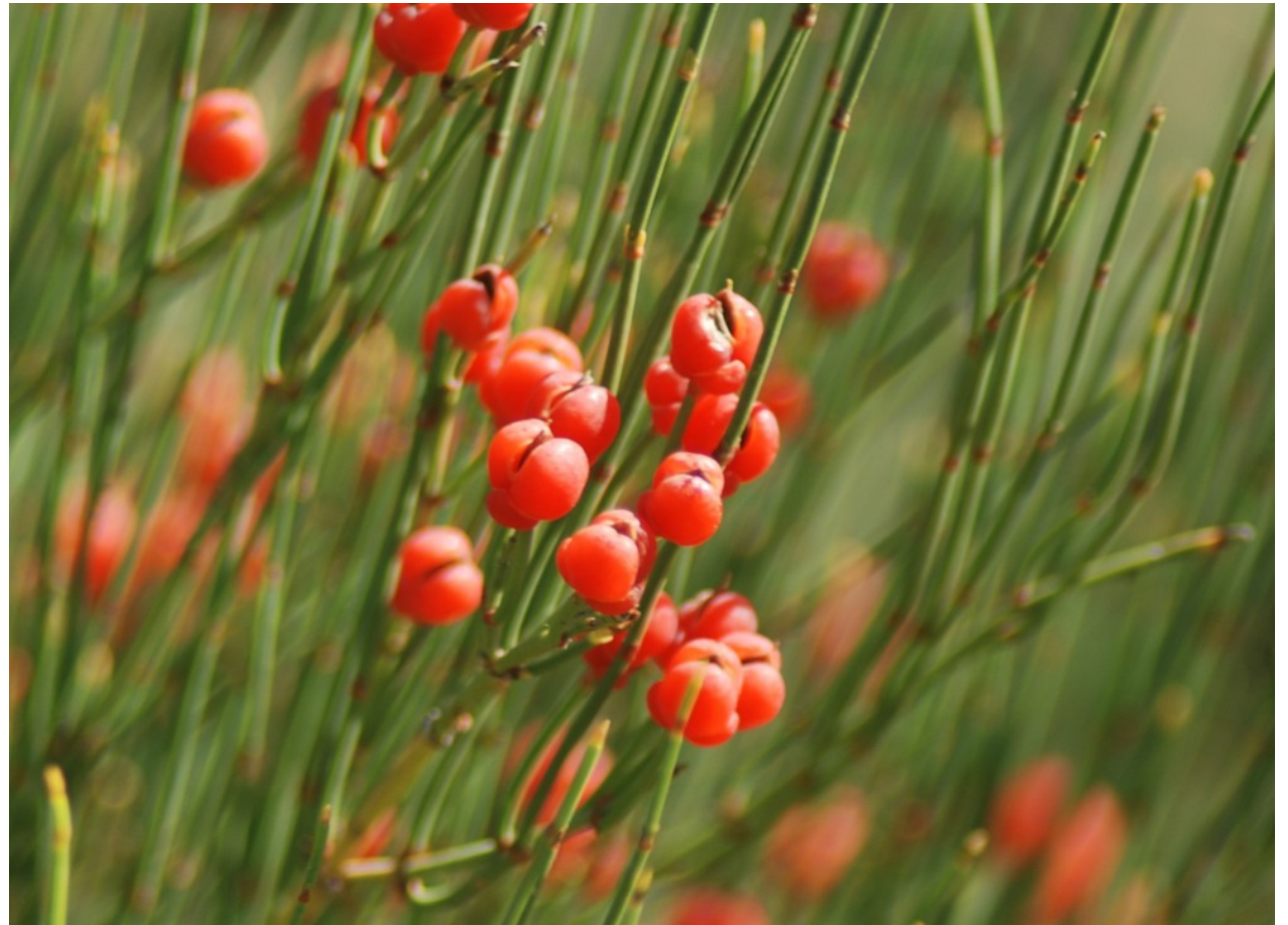
Foto 2: Ephedra nebrodensis . Ramas mostrando las semillas envueltas por una cubierta carnosa.

(1b) Árboles o arbustos de tallos no articulados; hojas aciculares o en forma de escama, más o menos verdes ..... 2