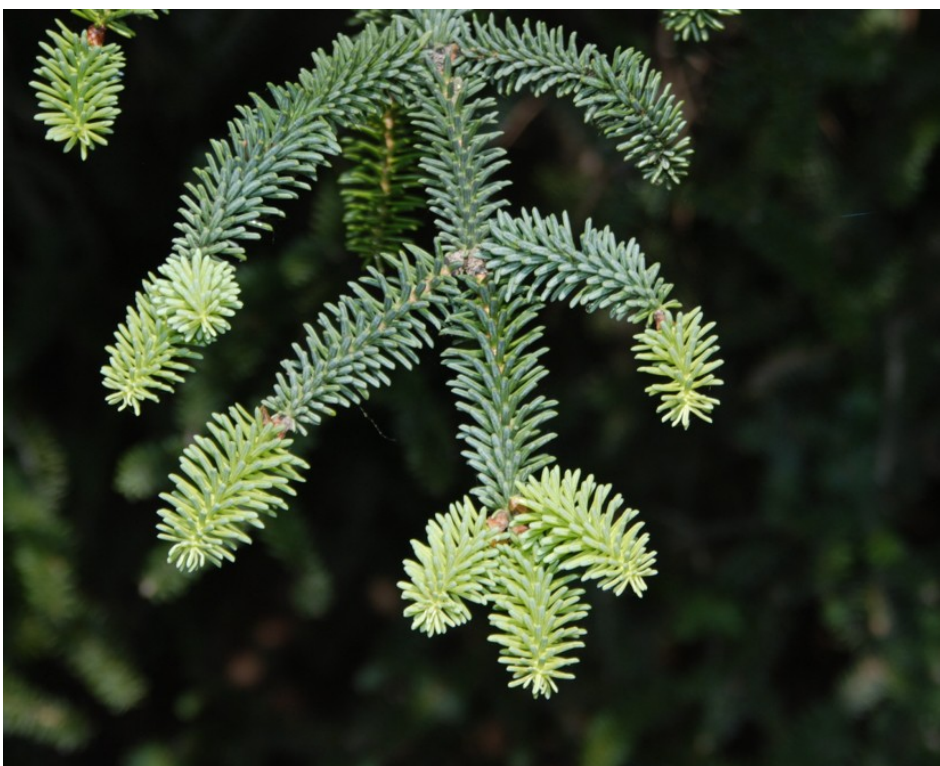
Foto 3: Abies pinsapo . Ramillas mostrando la disposición de las acículas.

(1b) Árboles o arbustos de tallos no articulados; hojas aciculares o en forma de escama, más o menos verdes ..... 2