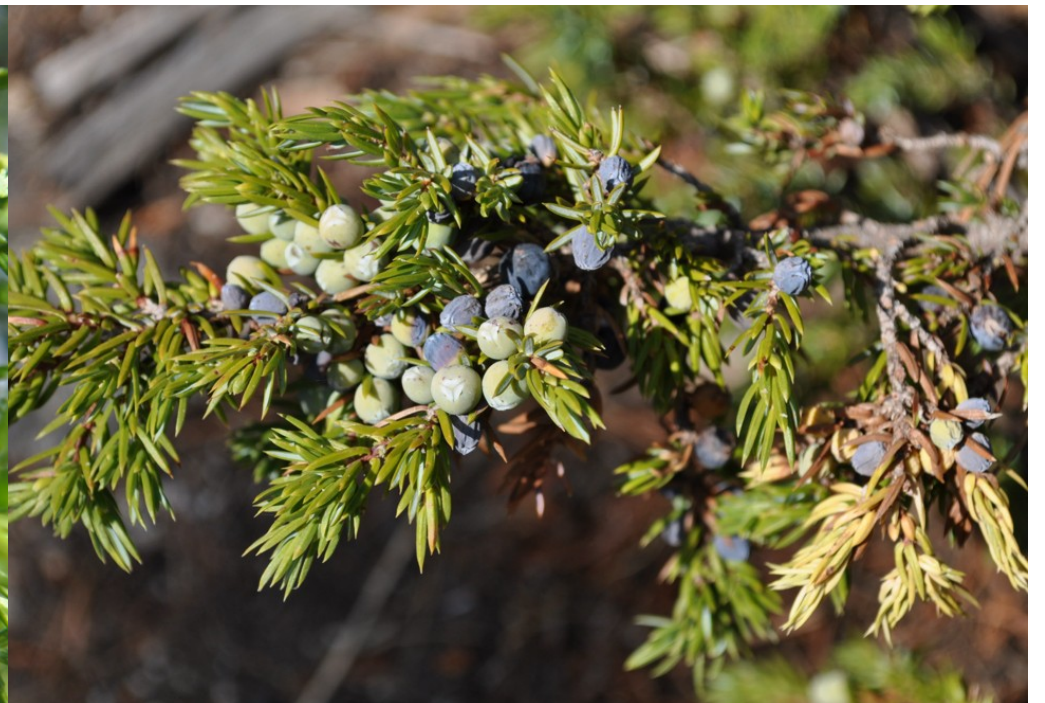
Foto 12: Juniperus communis subsp. alpina . Hojas aciculares y estróbilo carnoso (gálbulo).