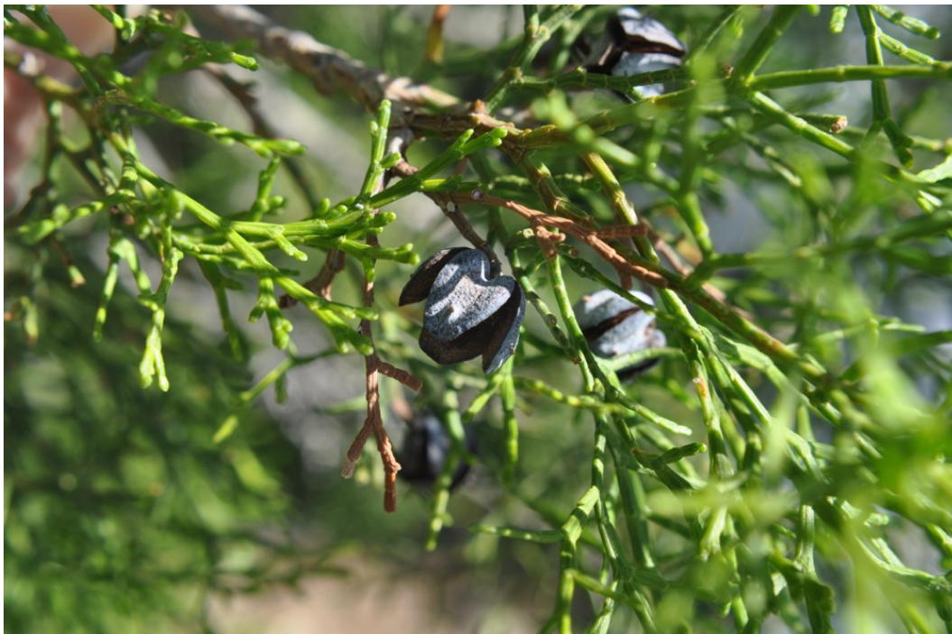
Foto 11: Tetraclinis articulata . Hojas en forma de escama y estróbilo leñoso, de forma más o menos redondeada.

(3b) Hojas en forma de escama o de tipo acicular-triangular ; estróbilos carnosos o leñosos, con las escamas opuestas o verticiladas , generalmente redondeados o un poco alargados..... CUPRESSACEAE