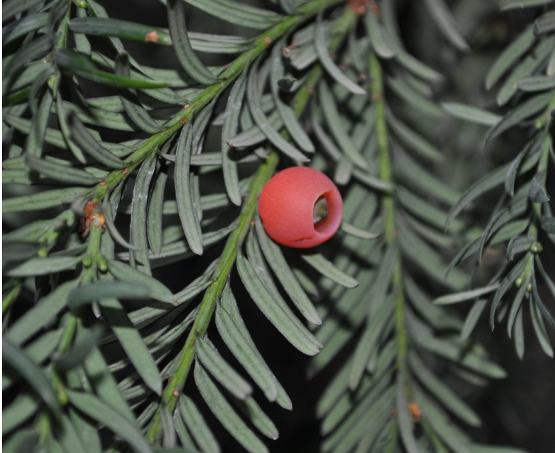
Foto 5: Taxus baccata . Semilla rodeada de un arilo de color rojo.