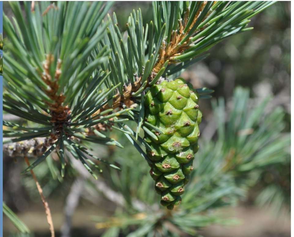
Foto 10: Pinus sylvestris . Acículas -dispuestas en grupos de dos- y piña.

(3b) Hojas en forma de escama o de tipo acicular-triangular ; estróbilos carnosos o leñosos, con las escamas opuestas o verticiladas , generalmente redondeados o un poco alargados..... CUPRESSACEAE