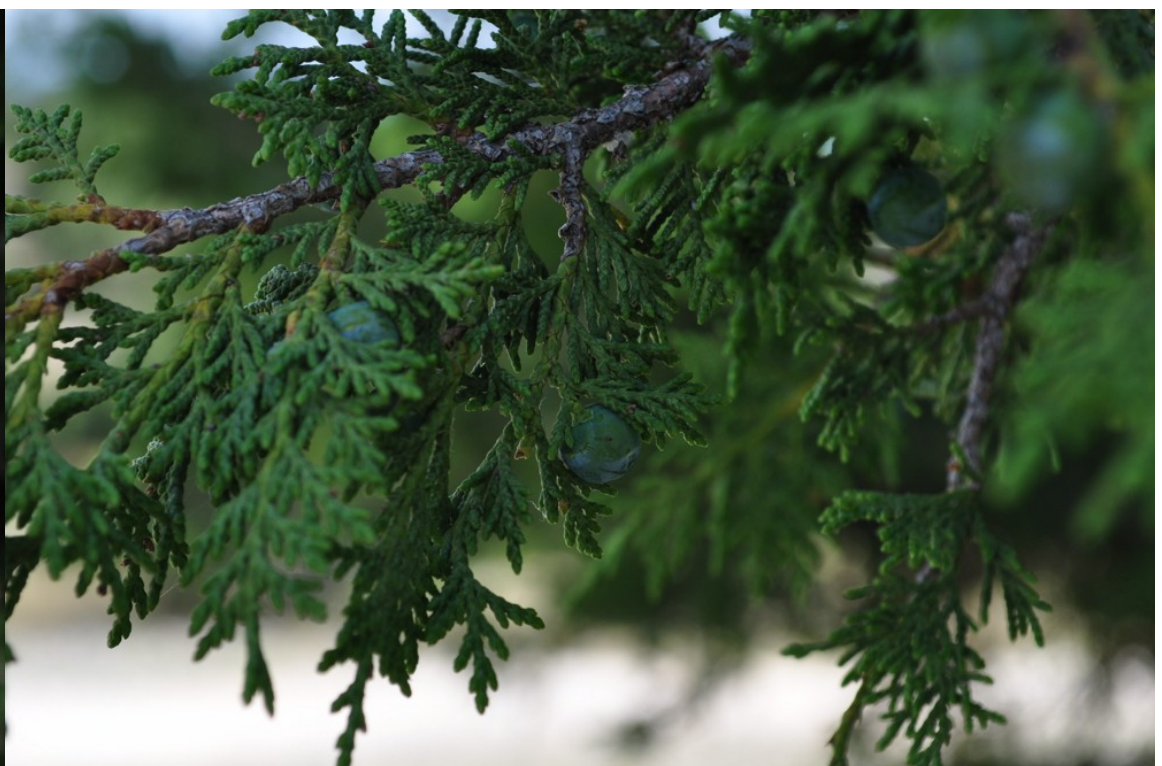
Foto 4: Juniperus thurifera . Ramillas donde se pueden ver las hojas en forma de escama.