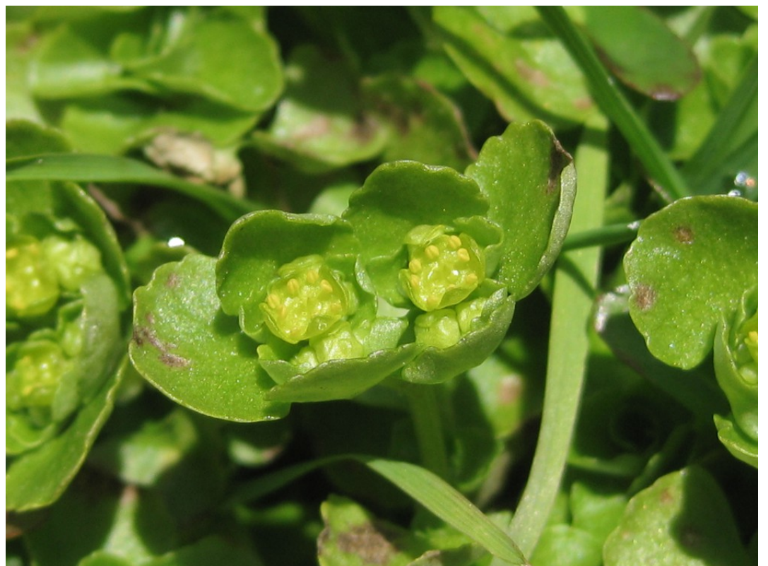
Foto 4: Chrysosplenium oppositifolium . Inflorescencias con flores cortamente pedunculadas y rodeadas de brácteas de morfología similar a las hojas.