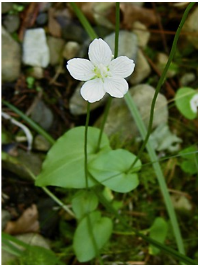
Foto 1: Parnassia palustris . Se trata de la única especie del género presente en la Península Ibérica e Islas Baleares. Se aprecia la flor solitaria sobre un pedúnculo largo.

1.- (1a) Flores solitarias, sobre largos pedúnculos . Diez estambres , cinco fértiles y cinco estériles (estaminodios) divididos en varios filamentos con ápice de aspecto glandular ..... Parnassia L. (Una sola especie ibérica: Parnassia palustris L. )