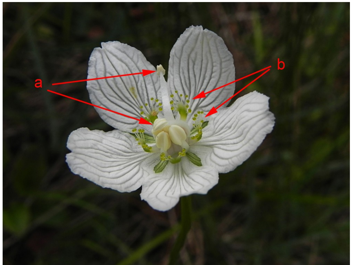
Foto 2: Parnassia palustris . Detalle de la flor. Se observan los cinco estambres fértiles (a), y los cinco estériles, divididos en filamentos con ápice glandular (b).

(1b) Flores en inflorescencias , nunca solitarias, con pedúnculos de tamaño variable, a veces muy cortos. Estambres todos fértiles, en número de ocho a diez ..... 2