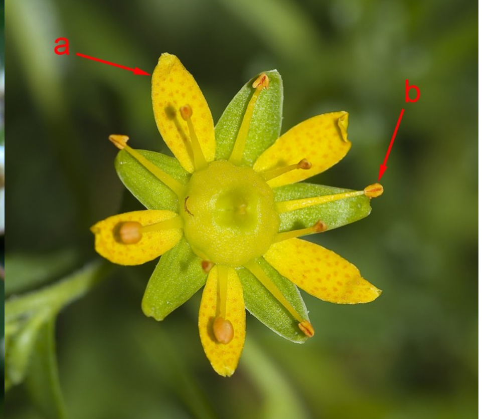
Foto 6: Saxifraga aizoides . Flor con cinco pétalos (a) y diez estambres (b).

(2b) Flores tetrámeras , sin pétalos . Ocho estambres ..... Chrysosplenium L.