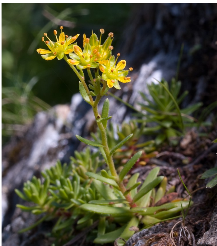
Foto 3: Saxifraga aizoides . Hábito e inflorescencia con flores claramente pedunculadas.

(1b) Flores en inflorescencias , nunca solitarias, con pedúnculos de tamaño variable, a veces muy cortos. Estambres todos fértiles, en número de ocho a diez ..... 2