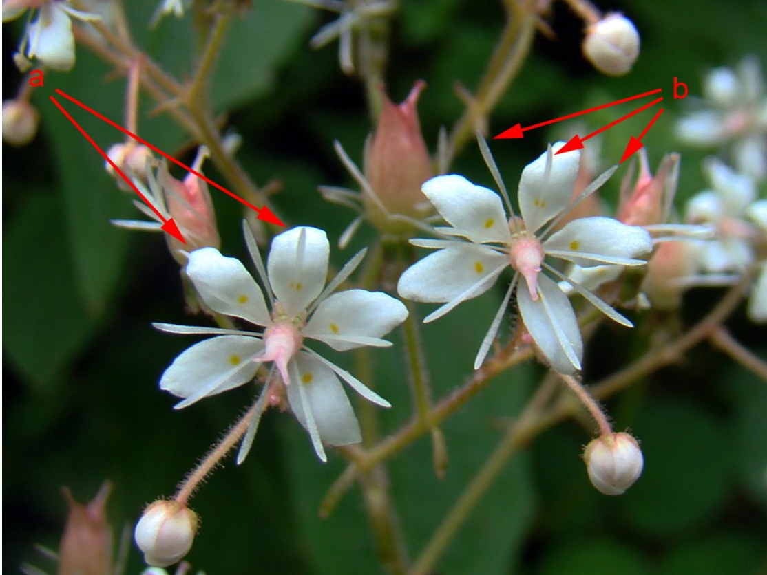
Foto 5: Saxifraga hirsuta subsp. hirsuta . Se aprecian los cinco pétalos (a) y los diez estambres (b).

2.- (2a) Flores pentámeras de cinco pétalos , a veces pequeños. Diez estambres ..... Saxifraga L.