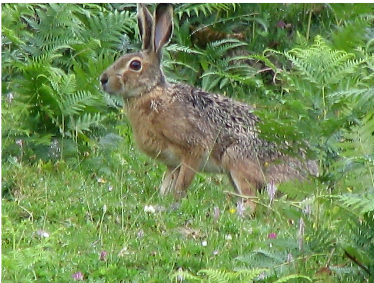
Foto 7: Lepus castroviejoi (Liebre de piornal). Es un endemismo ibérico cuyo habitat se encuentra restringido a las zonas altas de la cordillera Cantábrica. En la foto se puede apreciar la ausencia de la mancha blanca en la parte superior de las patas delanteras.

(2c) De tamaño intermedio, la zona ventral blanca no se encuentra tan ampliamente distribuida, estando ausente en la parte superior de las patas delanteras ..... Lepus castroviejoi Palacios 1977