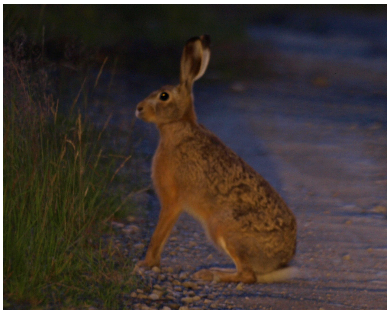
Foto 6: Lepus erupaeus (liebre europea). Se encuentra distribuida por toda la Cordillera Cantábrica, Pirineos, País Vasco, Burgos, Asturias y Palencia.

(2b) Es la de mayor tamaño de las tres. Las manchas ventrales blancas prácticamente resultan inexistentes ..... ..... Lepus europaeus Pallas 1778