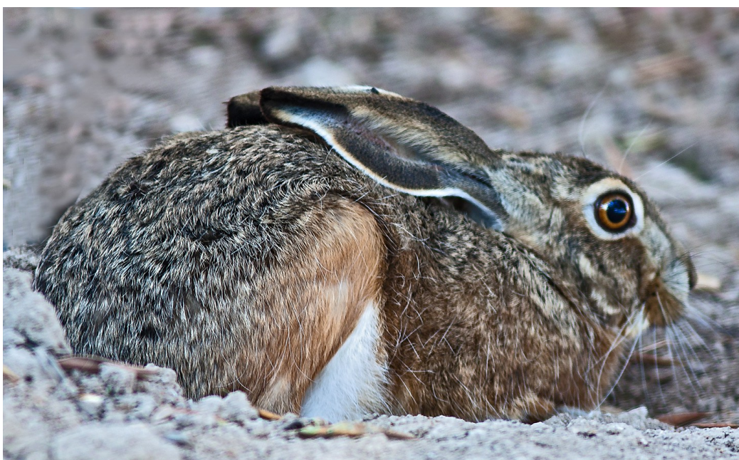
Foto 3: Lepus . Se aprecia con claridad la mayor longitud de las orejas con respecto a la cabeza

(1b) Mayor tamaño que el genero Oryctolagus . Cabeza más esbelta y orejas más largas que la cabeza, con el borde superior de color negro y forma puntiaguda. .... Lepus (Linnaeus 1758)