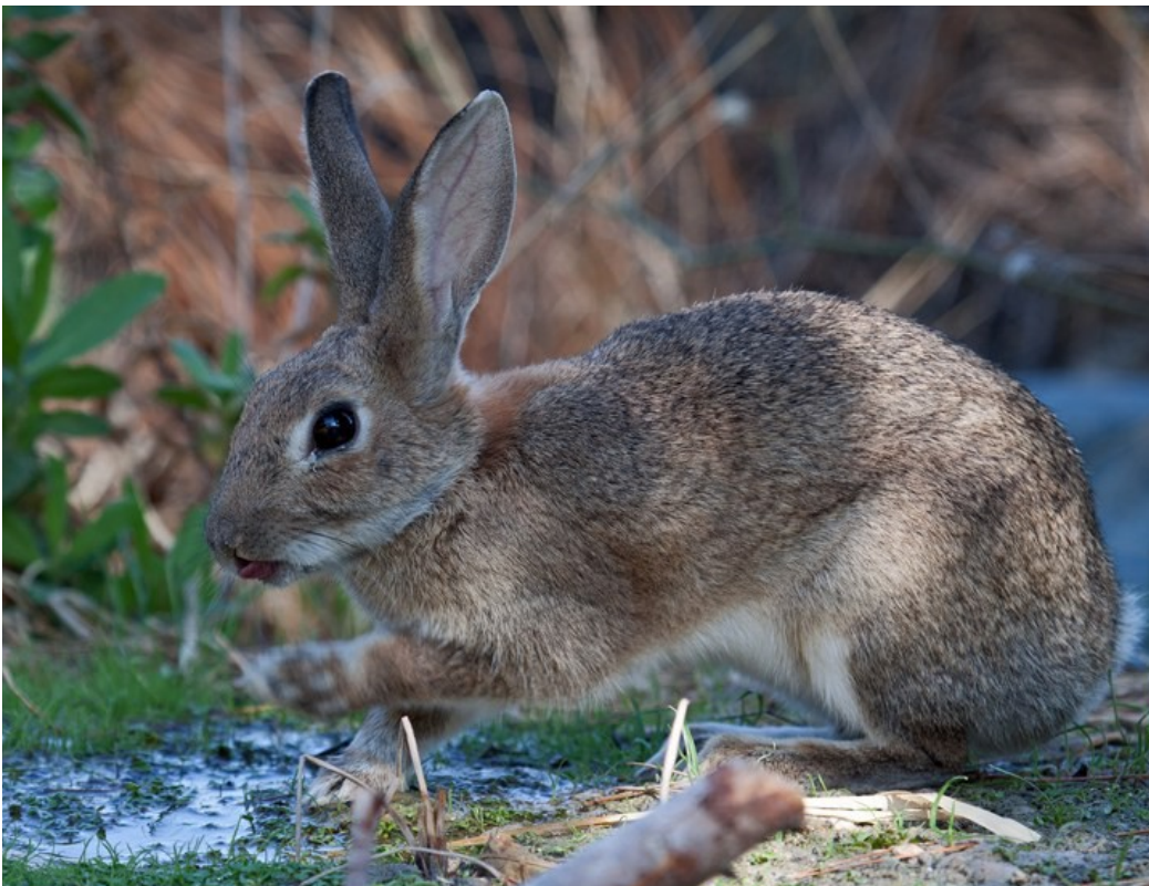
Foto 1: Oryctolagus cuniculus . Se aprecia el tamaño de las orejas, algo menor que la longitud de la cabeza

1.- (1a) De pequeño tamaño, con la cabeza redondeada, orejas de color uniforme de menor longitud que la cabeza y con las puntas redondeadas. .... Oryctolagus cuniculus (Linnaeus 1758)