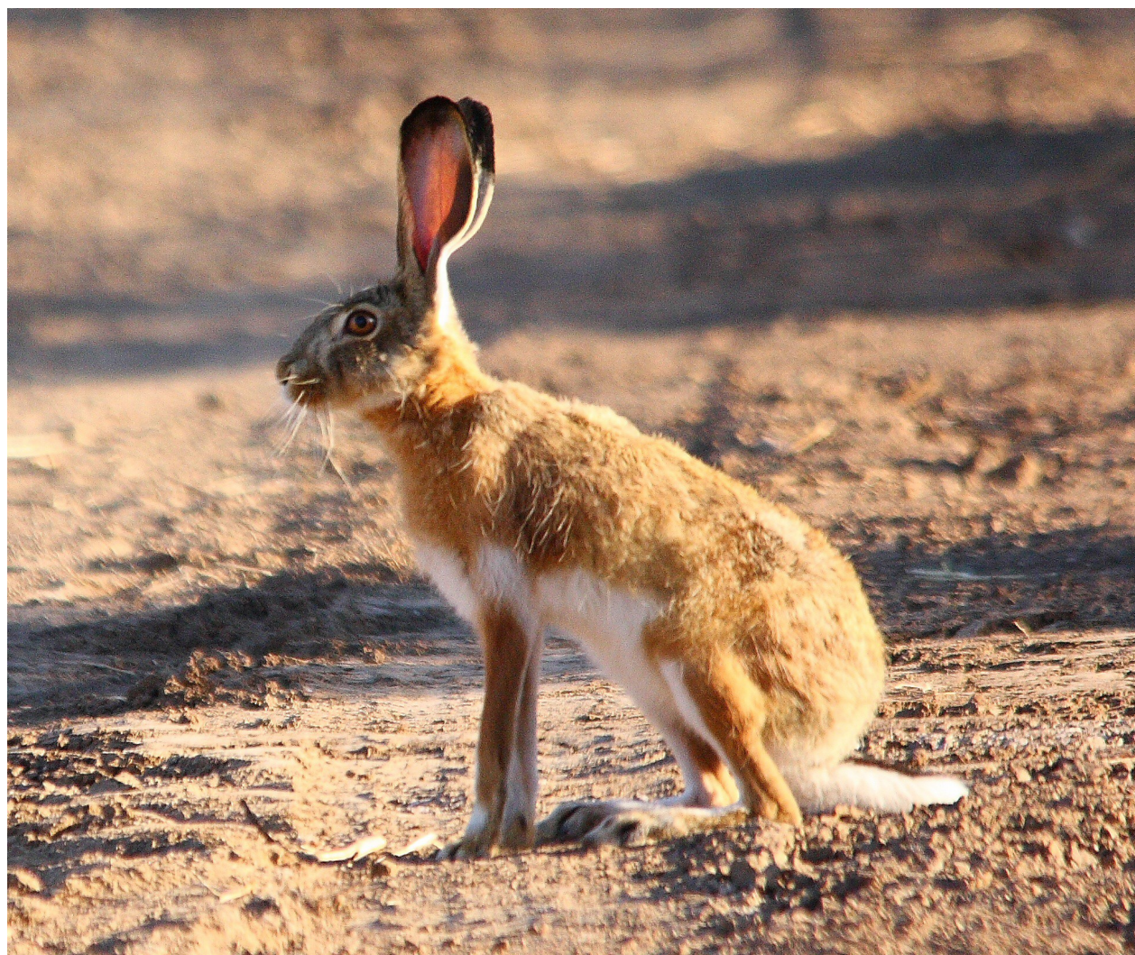
Foto 5: Lepus granatensis (Liebre ibérica). Distribuida por toda la península, se aprecia claramente la amplia zona ventral blanca.

2.- (2a) Es la de menor tamaño de las tres especies ibéricas. Presenta mancha ventral blanca ampliamente extendida ocupando pecho, vientre y parte superior de las patas delanteras ..... Lepus granatensis Rosenhauer 1856